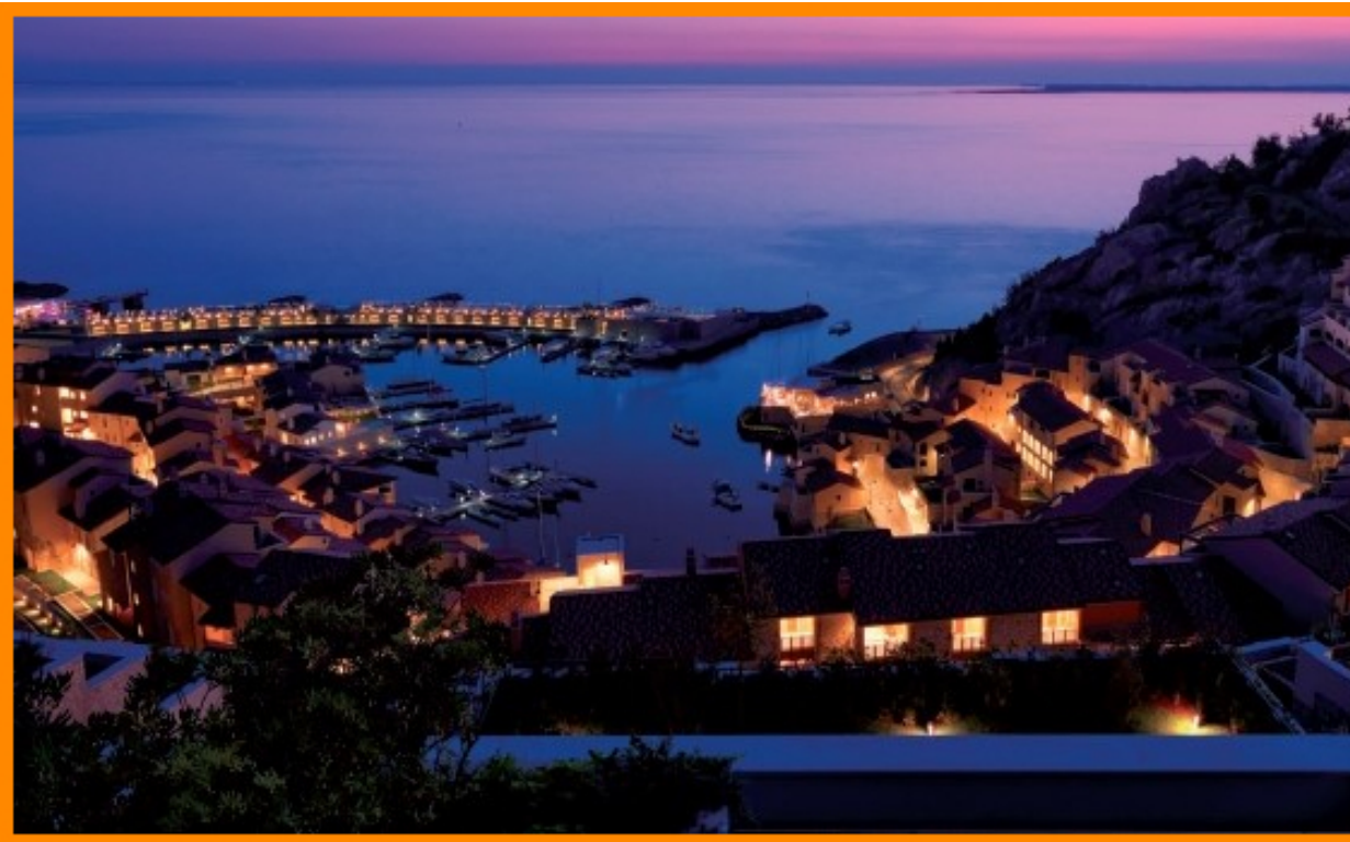
34011 Sistiana Italien