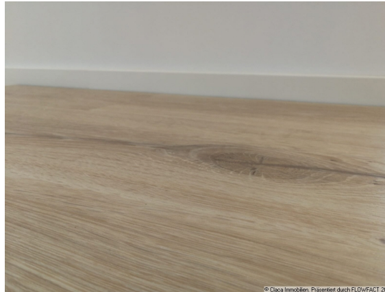
Bodenbelag Gerflor cedar pure