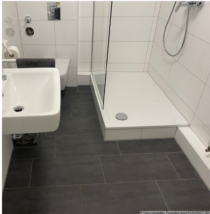
Beispielfoto Fliesen Bad