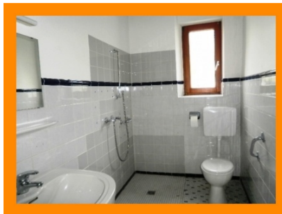
Tageslichtbad mit Waschbecken, Waschmaschinenanschluss, Dusche und WC