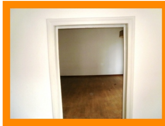
...mit Durchgang zum nächsten Zimmer