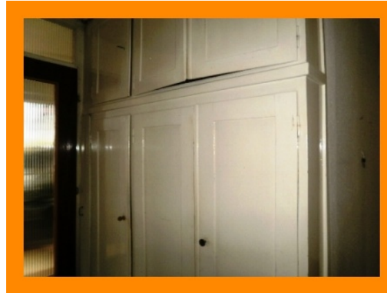
... mit Einbauschränk