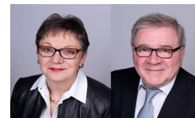
Ihre Immobilienmakler im Bereich Allgäu, Bodensee und Oberschwaben