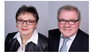
Ihre Immobilienmakler im Bereich Allgäu, Bodensee und Oberschwaben