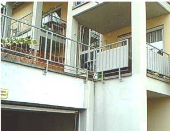
Terrasse vom Hof gesehen