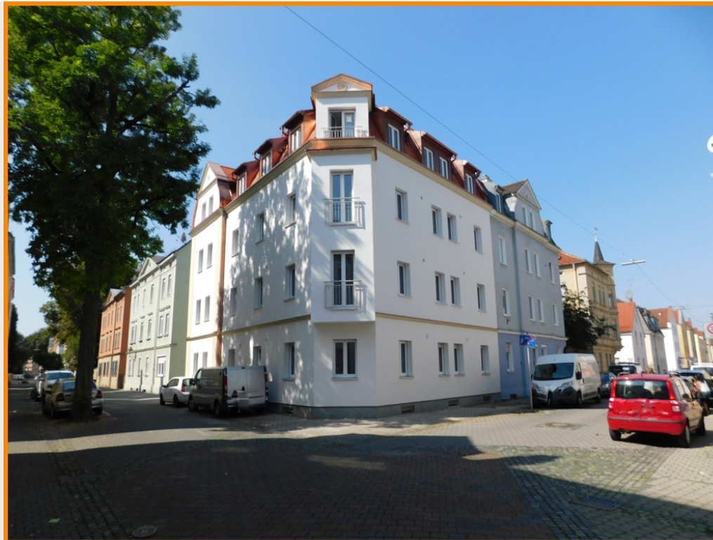
86154 Augsburg / Oberhausen Deutschland

Alles Neu - kernsanierte Wohnung im Erdgeschoß (Whg.2)