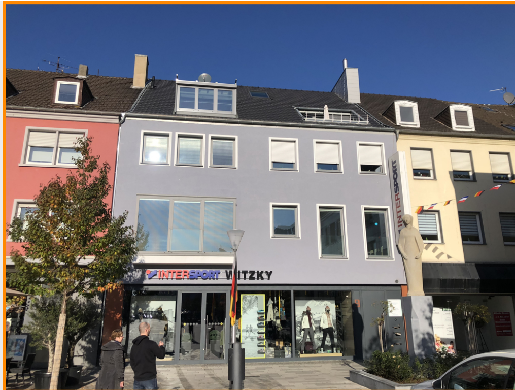
Markt 9 52349 Düren Deutschland